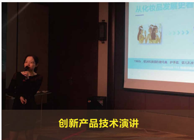
创新产品技术演讲