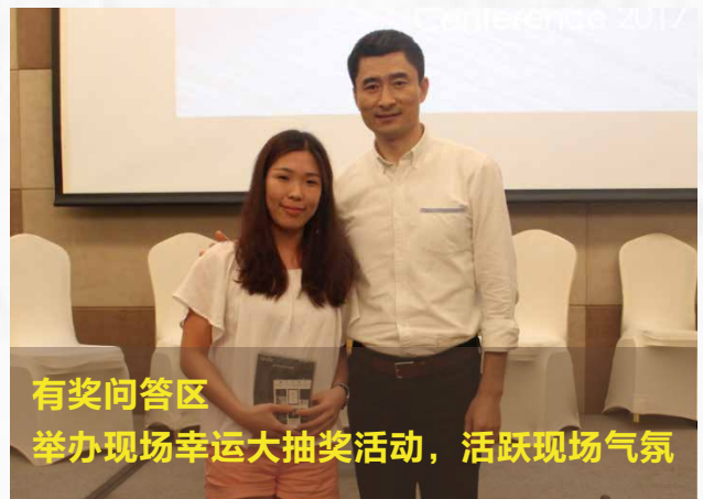
有奖问答区 举办现场幸运大抽奖活动，活跃现场气氛